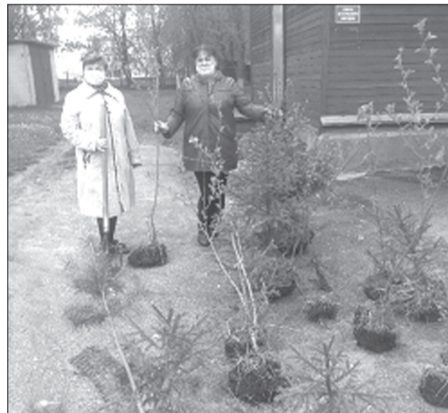
Приятно гулять по аллее, которая посажена своими руками

15 мая отмечался праздник, провозглашенный Генеральной Ассамблеей ООН как Международный день семьи.