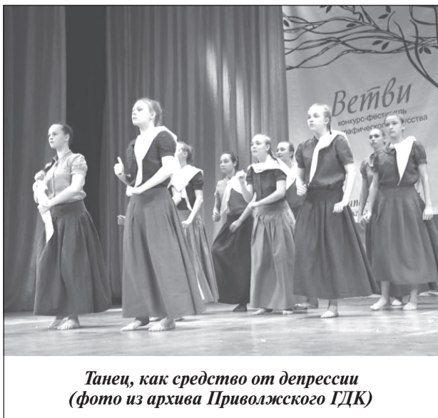
Танец, как средство от депрессии