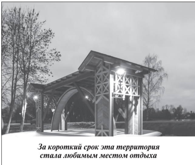
За короткий срок эта территория стала любимым местом отдыха

На территории парковой зоны «Верхний пруд» ведется плановая реставрация. Крайне неблагоприятные погодные условия осенью и зимой 2019 года сказались на качестве некоторых выполненных работ. Реставрация проводится в рамках гарантийных обязательств подрядчика и включает обновление плиточного покрытия пешеходных зон, а также покраску скамеек.