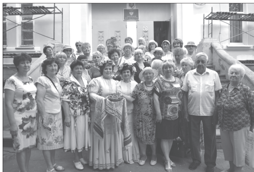
Гостям здесь рады всегда

В музей часто приходят целые школьные классы и группы дошколят. И, несмотря на всю, казалось бы, «взрослую» направленность тематических залов, домой возвращаются, увлеченно обсуждая экскурсию. И это – результат того, что музейщики к каждой категории своих посетителей умеют найти подход. Детям новая информация подается в игровой форме, многие экспонаты разрешается трогать руками и даже испытать в действии. Собственно, такой интерактив касается