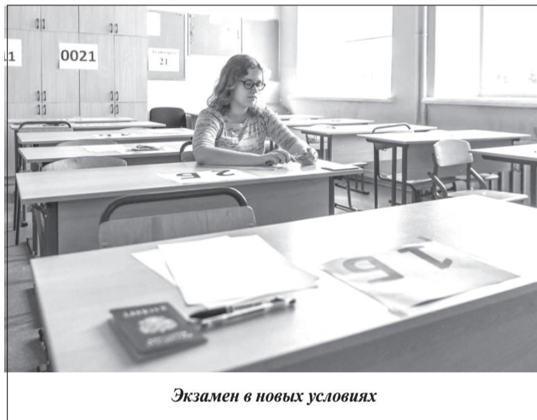
Экзамен в новых условиях

- Действительно, ЕГЭ для одиннадцатиклассников не отменён. Экзамен состоится, и дата его проведения уточняется. Все будет известно 25 мая, когда состоится заседание правительства, на котором и будут расставлены все точки над i в этом вопросе. Надеемся, что мы получим ответы и на все сопутствующие вопросы: какие экзамены будет сдавать выпускник – обязательные или по выбору, все ли это будут делать или только те, кто хочет поступать в вуз. Осталось подождать немного. Будем руководствоваться документами. Известно, что есть предложения провести ЕГЭ очно в соответствии с правилами сегодняшнего дня - при малой наполняемости аудитории и т.д., есть предложения провести экзамен онлайн. Но в любом случае, всё, что от нас потребуется, выполним.