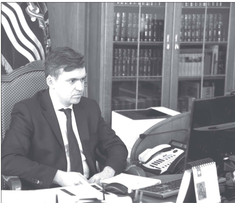
Станислав Воскресенский: «Сейчас с органов власти повышенный спрос...»

кому она требуется. Об этом сказал губернатор Станислав Воскресенский на встрече с представителями политических партий и общественных организаций, которая состоялась 15 мая, в видеоформате.