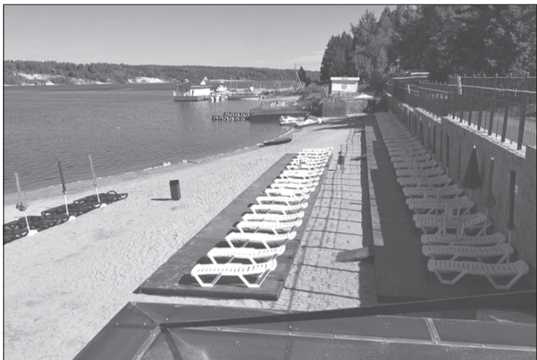
Обновлённый плёсский пляж неизвестно когда дожждётся отдыхающих, пандемия внесла свои коррективы

В указ губернатора «О введении на территории Ивановской области режима повышенной готовности» внесены уточнения некоторых положений по работе объектов розничной торговли, деятельности органов государственной и муниципальной власти, подведомственных учреждений по предоставлению государственных и муниципальных услуг. Также введены ограничения на работу пляжей до специального распоряжения.